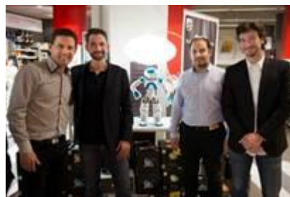
NAO – Episode 1 au magasin Darty République

Au cours des prochaines dates, NAO étendra ses compétences afin de démontrer différents produits de l'offre maison connectée Darty. Il sera également présenté courant février / mars 2015 à Lille, Bordeaux, Bruxelles et Amsterdam.