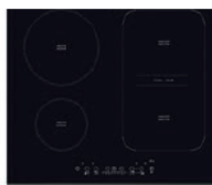
TABLE 4 FOYERS INDUCTION Une zone modulable, foyer principal 4000 W, 4 boosters, 11 positions de cuisson. ACM912BF/04, PVS* 549 €.

PLUS D'ÉCONOMIES POUR L'ACHAT SUPPLÉMENTAIRE DU LAVE-VAISSELLE