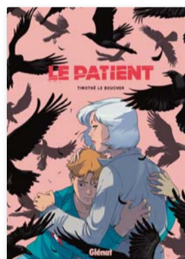
Le Patient Timothé Le Boucher GLÉNAT