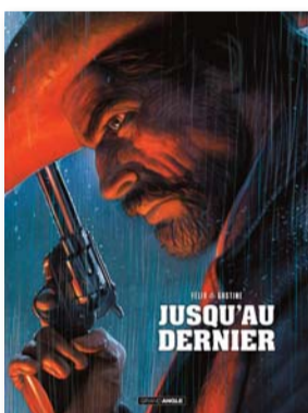
Jusqu'au dernier Histoire complète Jérôme Félix & Paul Castine BAMBOO ÉDITIONS