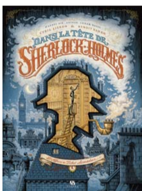
Dans la tête de Sherlock Holmes Tome 1 Benoît Dahan & Cyril Liéron ANKAMA