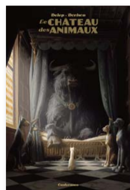
Le Château des Animaux Tome 1 : Miss Bangalore Xavier Dorison & Félix Delep CASTERMAN