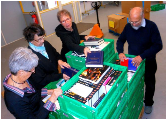
Tri des produits par les bénévoles en amont