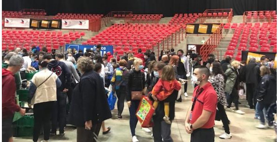
Braderie Solidaire Fnac le jour j