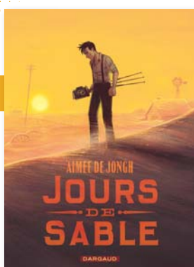
Jours de sable Aimée de Jongh DARGAUD