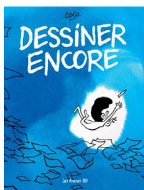
Dessiner encore Coco LES ARÈNES