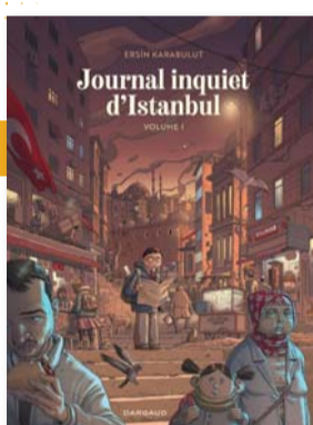
Journal inquiet d'Istanbul Volume 1 Ersin Karabulut DARGAUD