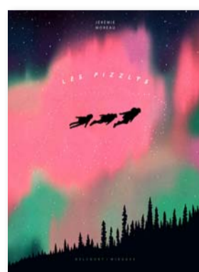
Les Pizzlys Jérémie Moreau DELCOURT