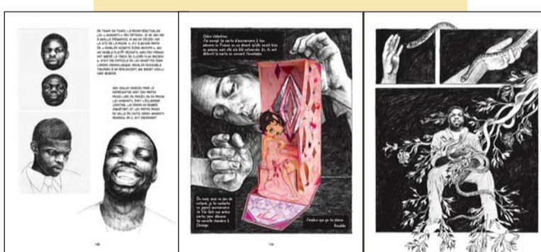
Perpendiculaire au soleil de Valentine Cuny-Le Callet © Éditions Delcourt - 2022

Ses images singulières parlent de la beauté du monde, mais aussi des conditions extrêmes dans lesquelles elles ont vu le jour. Au-delà du témoignage autobiographique, ce récit explore avec une émotion intense la brutalité d'un système carcéral, la représentation des victimes, et la ténacité avec laquelle les condamnés cherchent à construire leur vie, depuis une cellule de cinq mètres carrés.