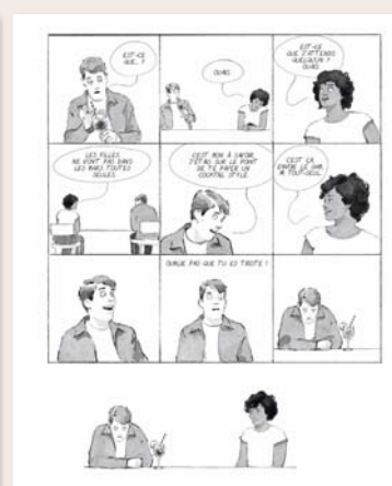
Au-dedans de Will McPhail © 404 Éditions - 2024